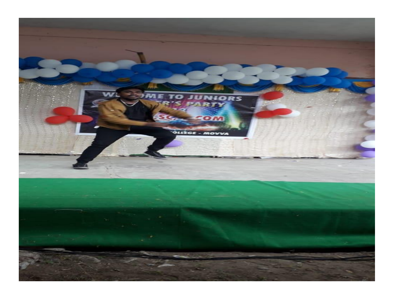
Page 7 of 8